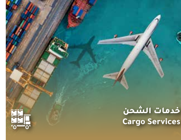
خدمات الشحن Cargo Services

We provide customer service 24/7 with the possibility of amendment and cancellation to ensure that our clients' needs are met in record time and with great care.