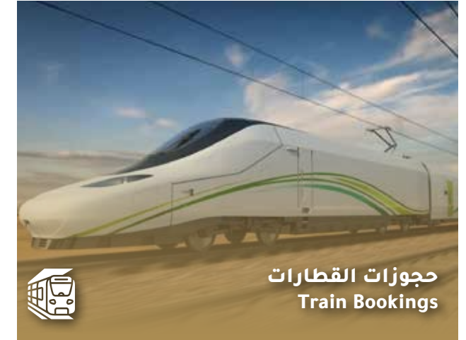
حجوزات القطارات Train Bookings