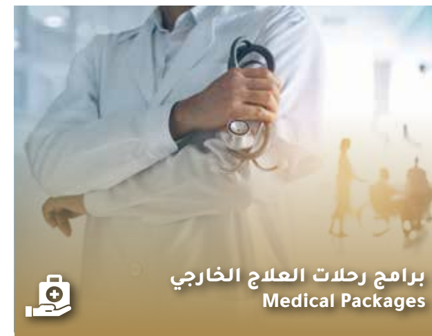
برامج رحلات العلاج الخارجي Medical Packages