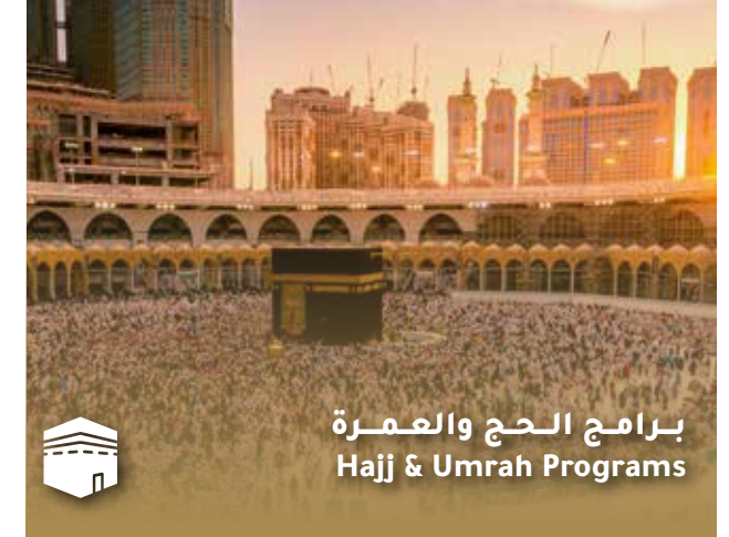
برامج الحج والعمرة Hajj & Umrah Programs