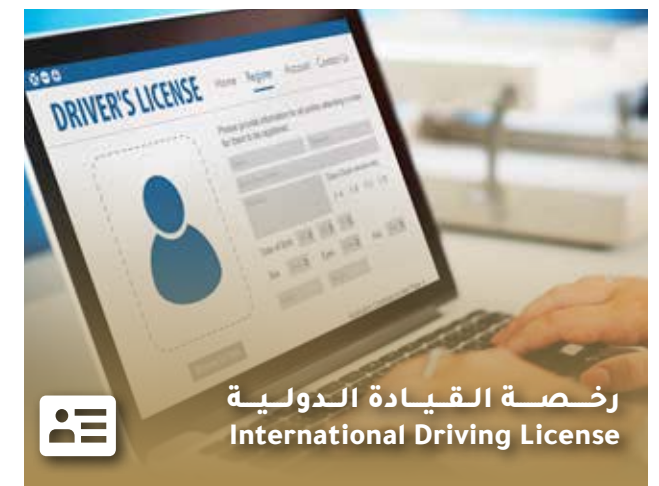
رخصة القيادة الدولية International Driving License