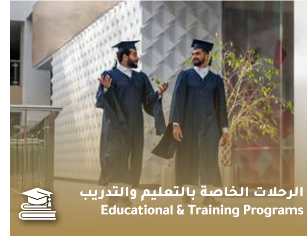
الرحلات الخاصة بالتعليم والتدريب Educational & Training Programs